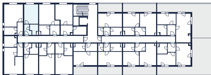
2. nadzemní podlaží | Schéma umístění bytu 216

+420 777 114 302 prodej@uarborky.cz www.uarborky.cz