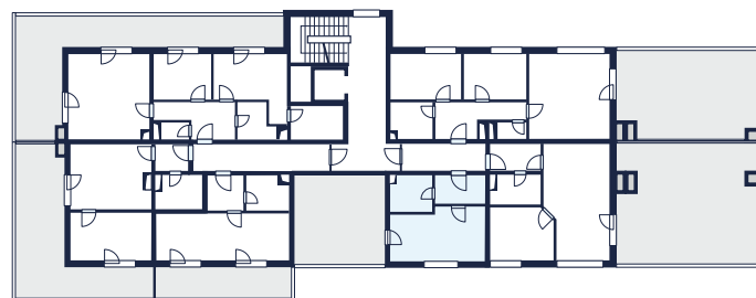
3. nadzemní podlaží | Schéma umístění bytu 327

+420 777 114 302 prodej@uarborky.cz www.uarborky.cz